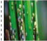
বাদামী গাছ ফড়িং