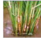
ধানের খোল পোড়া